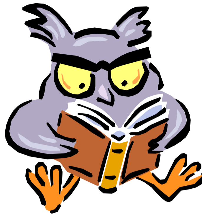
Beschreibende Grafik- oder Bildunterschrift.

Viele Inhalte Ihres Magazins eignen sich auch für eine Website. Mit Microsoft Publisher können Sie Ihr Magazin leicht in eine Website