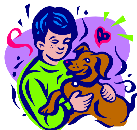
Beschreibende Grafik- oder Bildunterschrift.

Platzieren Sie die gewählte Abbildung dicht