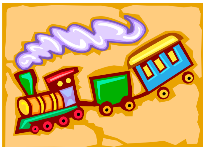
Beschreibende Grafik- oder Bildunterschrift.

Bedenken Sie die Aussage Ihres Artikels, und verwenden Sie