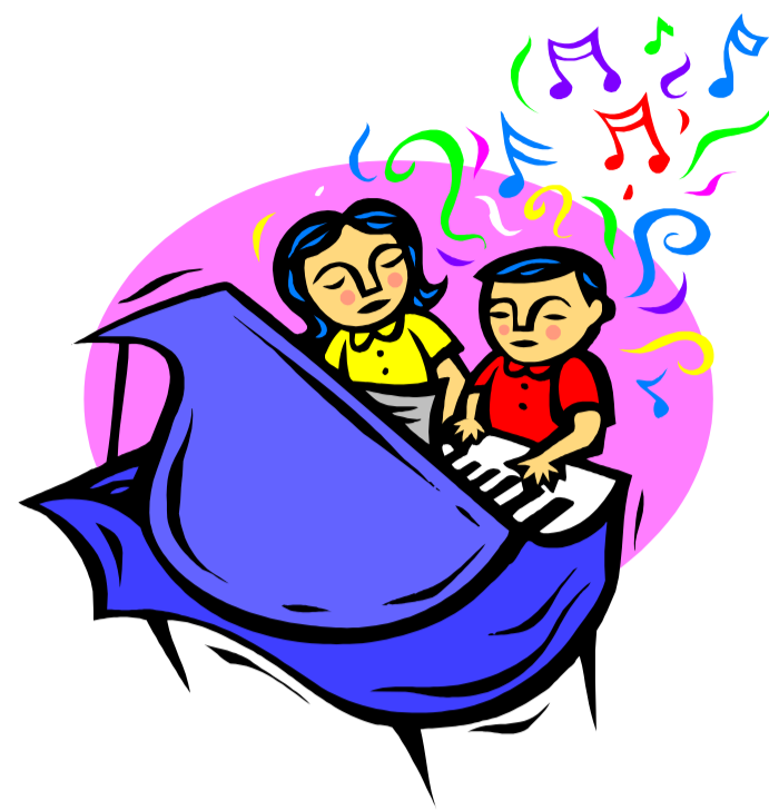
Beschreibende Grafik- oder Bildunterschrift.

Viele Inhalte Ihres Magazins eignen sich auch für eine Website. Mit Microsoft Publisher können Sie Ihr Magazin leicht in eine Website