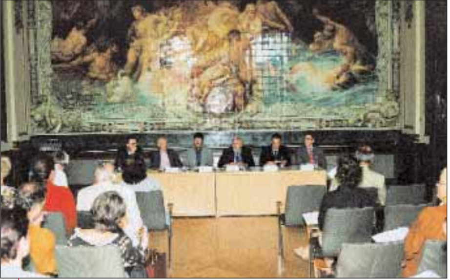
Die Vertreter der DGZ standen den Journalisten vor prachtvollem Hintergrund Rede und Antwort.