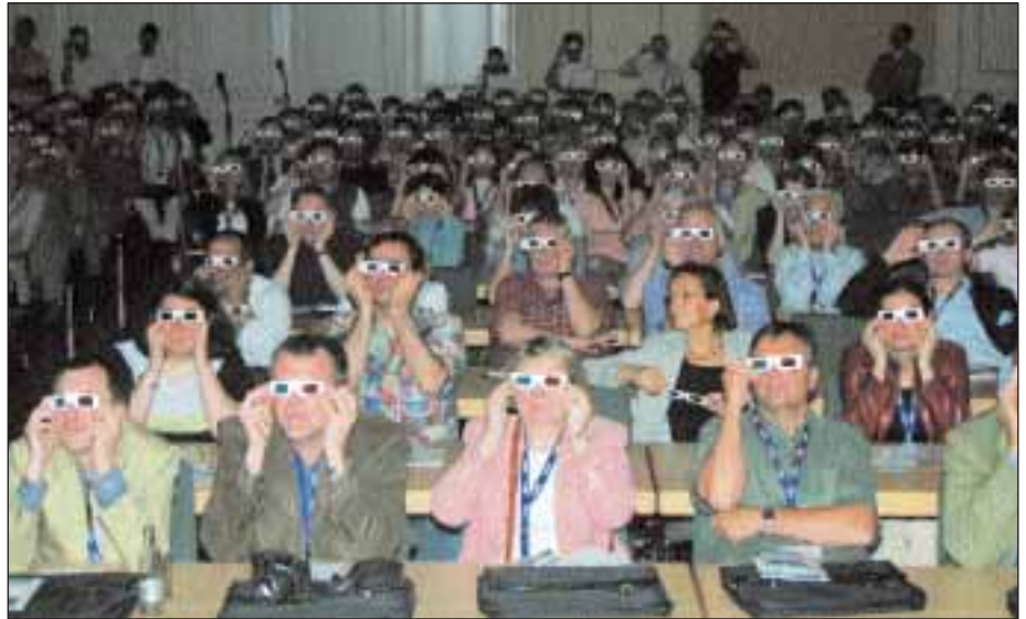
Auditorium des Vorsymposiums mit 3-D-Brille.