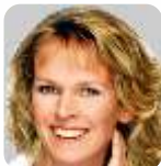
ZMF Birgit Sayn Leverkusen

Mahler Saal - Historische Stadthalle Wuppertal Johannisberg 40, 42103 Wuppertal (siehe Seite 10)