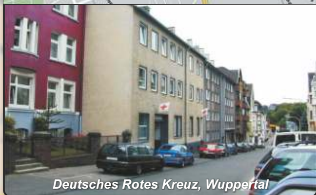
Deutsches Rotes Kreuz, Wuppertal